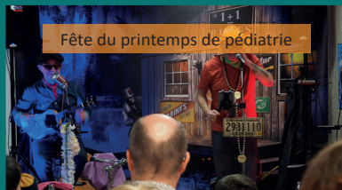
Fête du printemps de pédiatrie