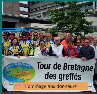
Tour de Bretagne des greffés Hommage aux donneurs