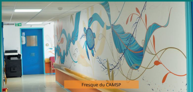
Fresque du CAMSP