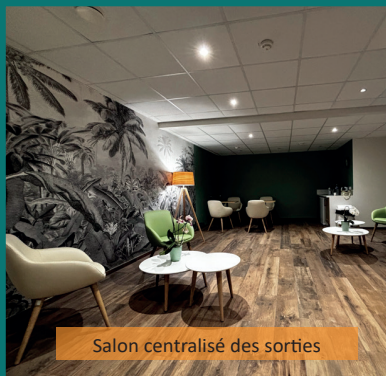
Salon centralisé des sorties