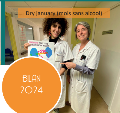
Dry January (mois sans alcool)