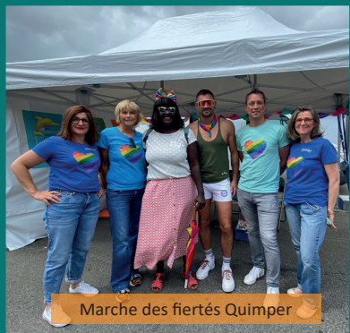
Marche des fiertés Quimper