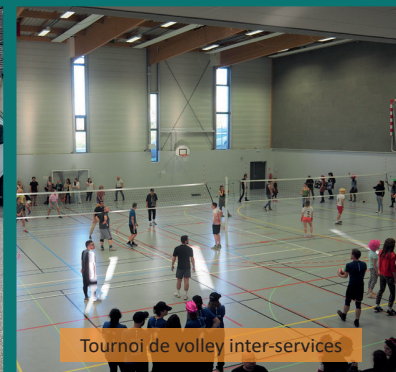
Tournoi de volley inter-services