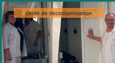
Unité de décontamination