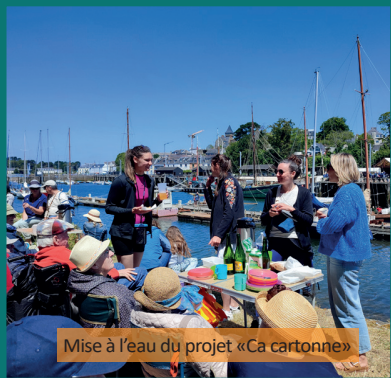
Mise à l'eau du projet «Ça cartonne»