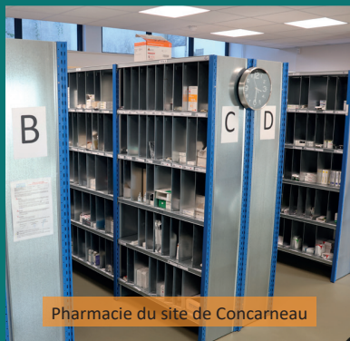
Pharmacie du site de Concarneau