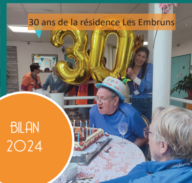
30 ans de la résidence Les Embruns