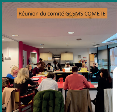
Réunion du comité GCSMS COMETE