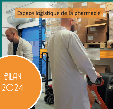
Espace logistique de la pharmacie