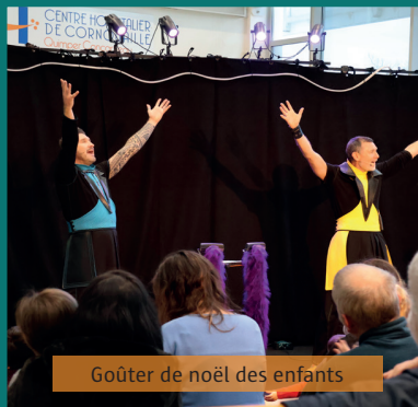
Goûter de Noël des enfants