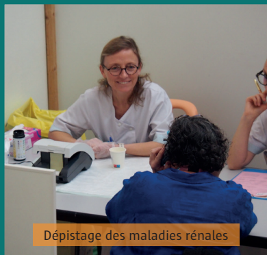
Dépistage des maladies rénales