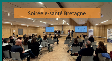
Soirée e-santé Bretagne