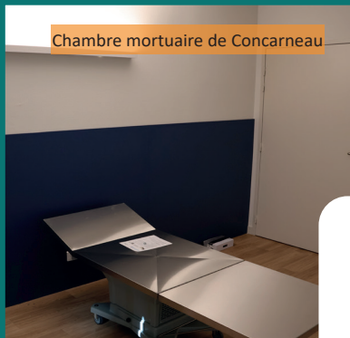
Chambre mortuaire de Concarneau