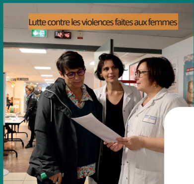
Lutte contre les violences faites aux femmes