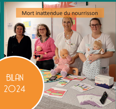
Mort inattendue du nourrisson