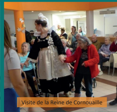
Visite de la Reine de Cornouaille