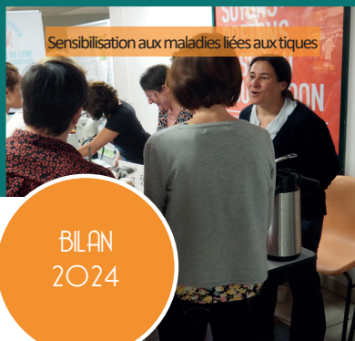
Sensibilisation aux maladies liées aux tiques