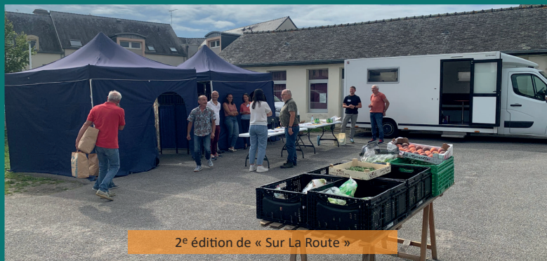
2 e édition de « Sur La Route »