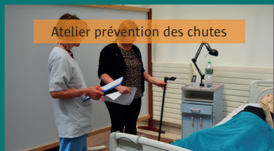
Atelier prévention des chutes