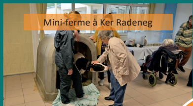
Mini-ferme à Ker Radeneg