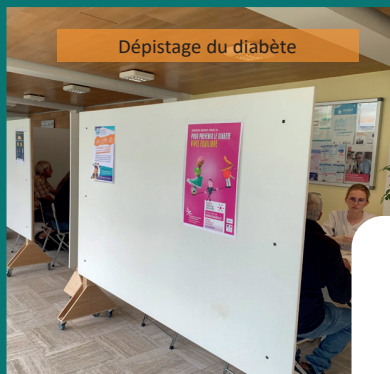
Dépistage du diabète