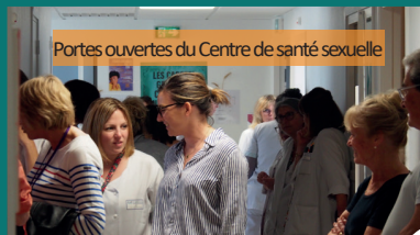
Portes ouvertes du Centre de santé sexuelle